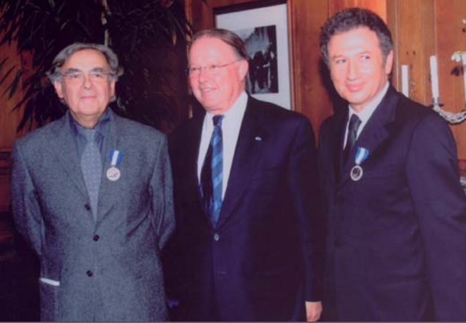
Bernard Pivot, C.Q., Michel Drucker, C.Q., et Bernard Landry, premier ministre du Québec /, Paris 2001