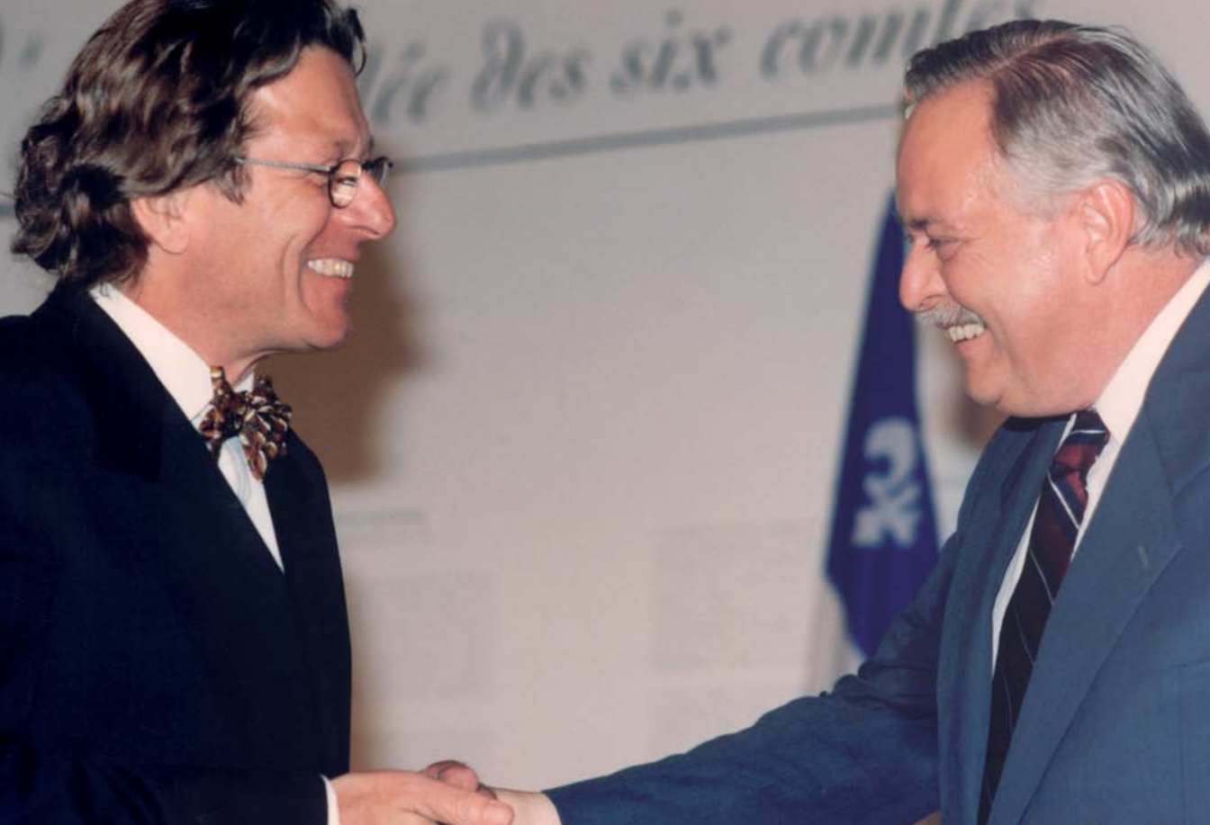
Albert Millaire, C.Q., et Jacques Parizeau, premier ministre du Québec