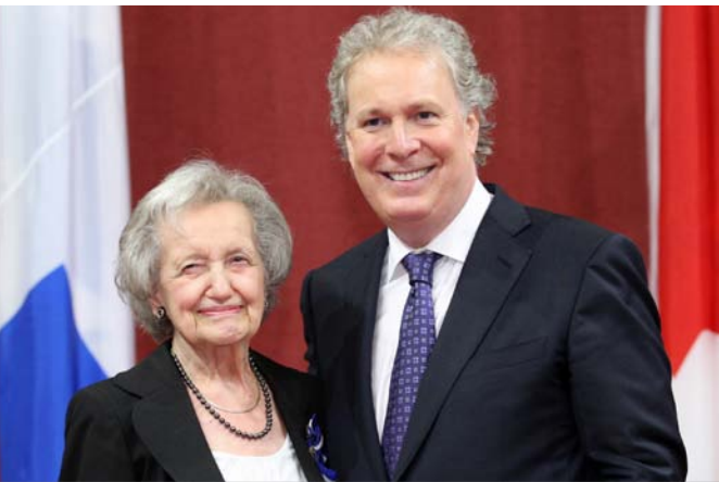
Brenda Milner, G.O.Q., et Jean Charest, premier ministre du Québec / ONQ - 2009