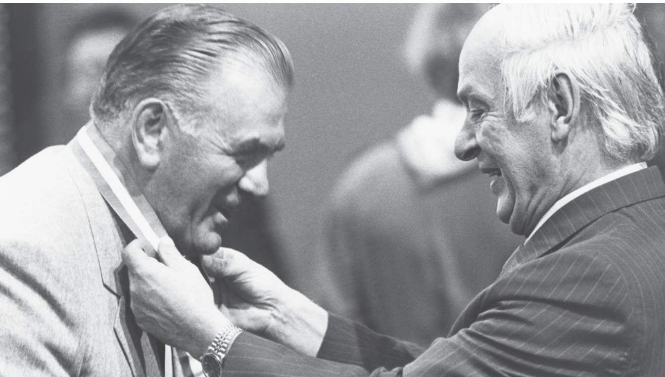
Maurice Richard, O.Q., et René Lévesque, premier ministre du Québec