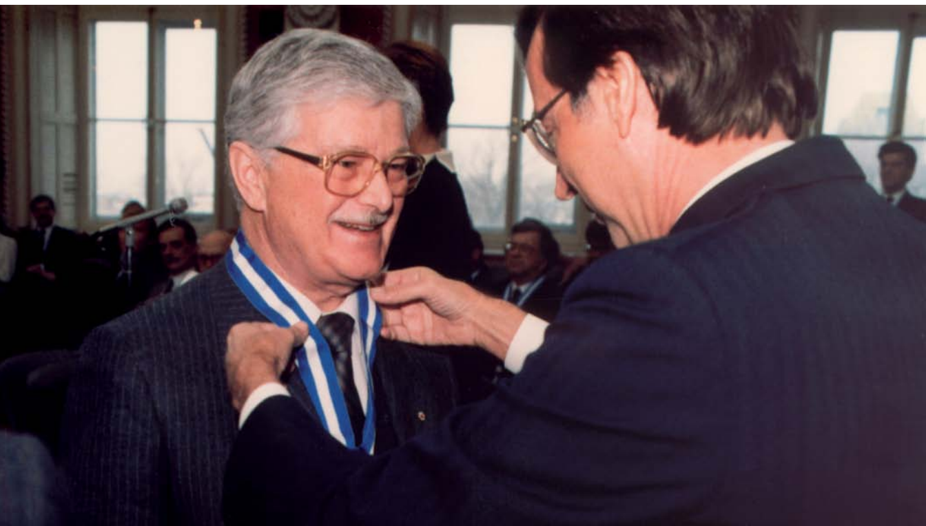
Paul Gérin-Lajoie, O.Q., et Robert Bourassa, premier ministre du Québec