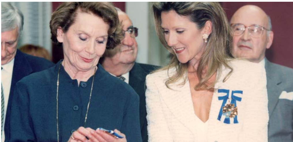
Françoise Faucher, O.Q., et Céline Dion, O.Q.