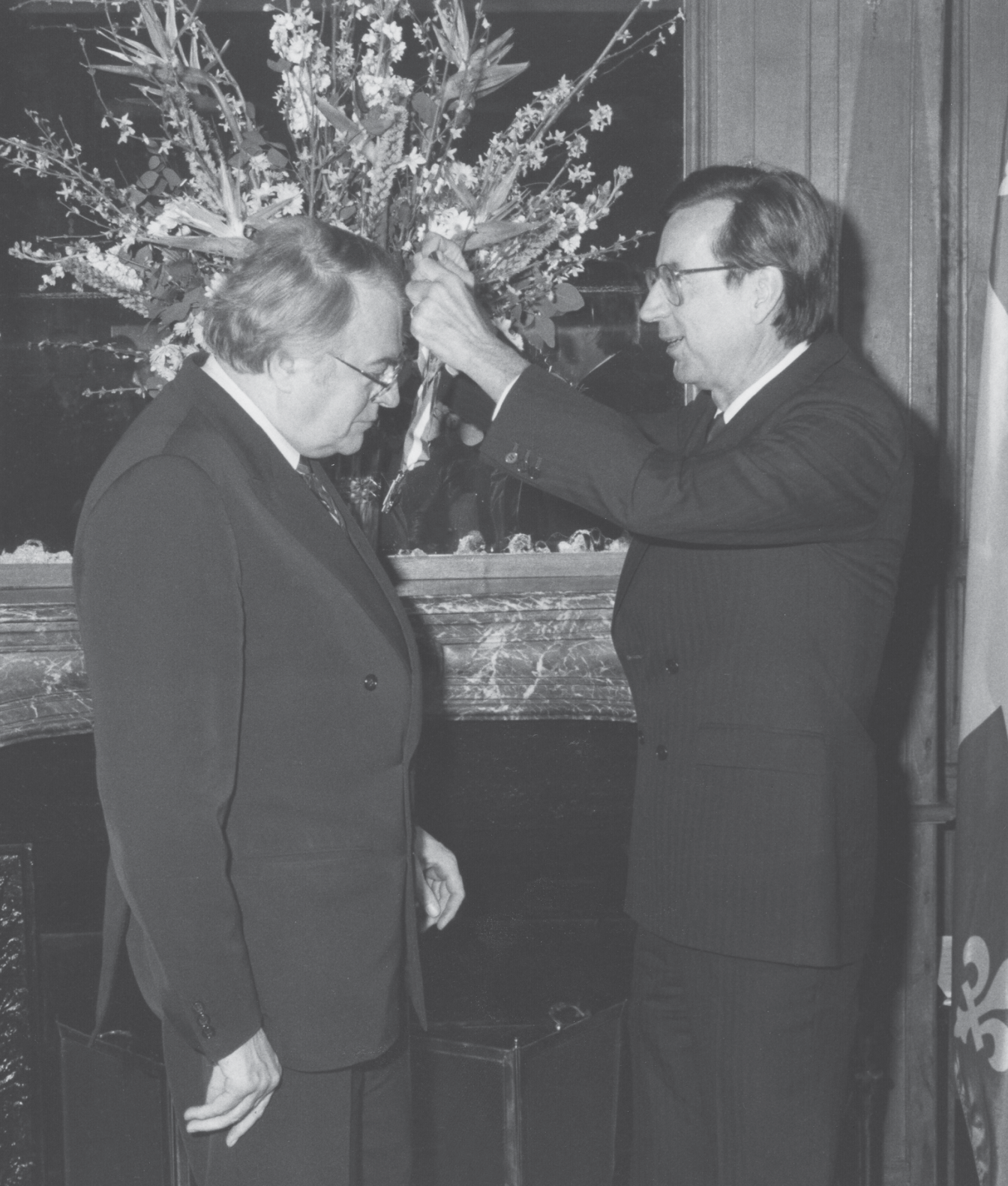
Pierre Mauroy, O.Q., premier ministre de la République française de 1981 à 1984, et Robert Bourassa, premier ministre du Québec / Jean-Bernard Porée, 1986