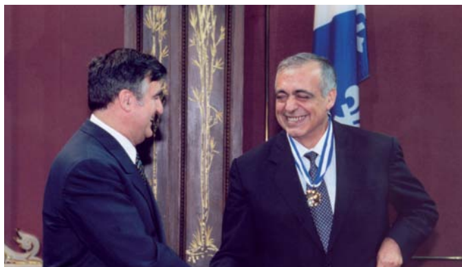
Lucien Bouchard, premier ministre du Québec, et Philippe Séguin, O.Q.