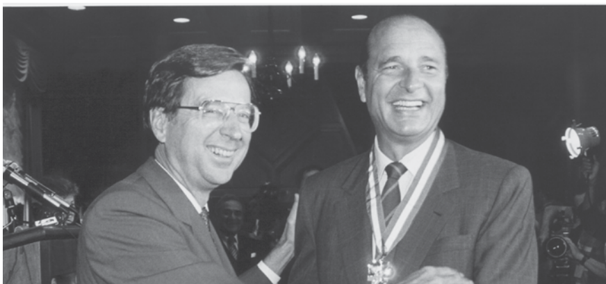
Robert Bourassa, premier ministre du Québec et Jacques Chirac, O.Q., premier ministre de la République française de 1986 à 1988

Jacques Chirac deviendra par ailleurs la quatrième personnalité française à recevoir l'insigne de l'Ordre. La cérémonie d'intronisation aura lieu au Château Frontenac à l'occasion du deuxième Sommet de la francophonie tenu à Québec au début du mois de septembre 1987.