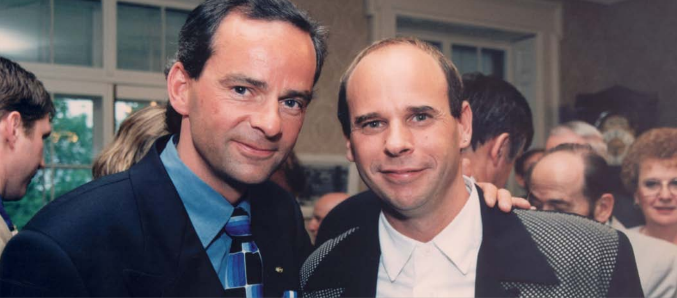
Louis Garneau, C.Q., et Guy Laliberté, C.Q.