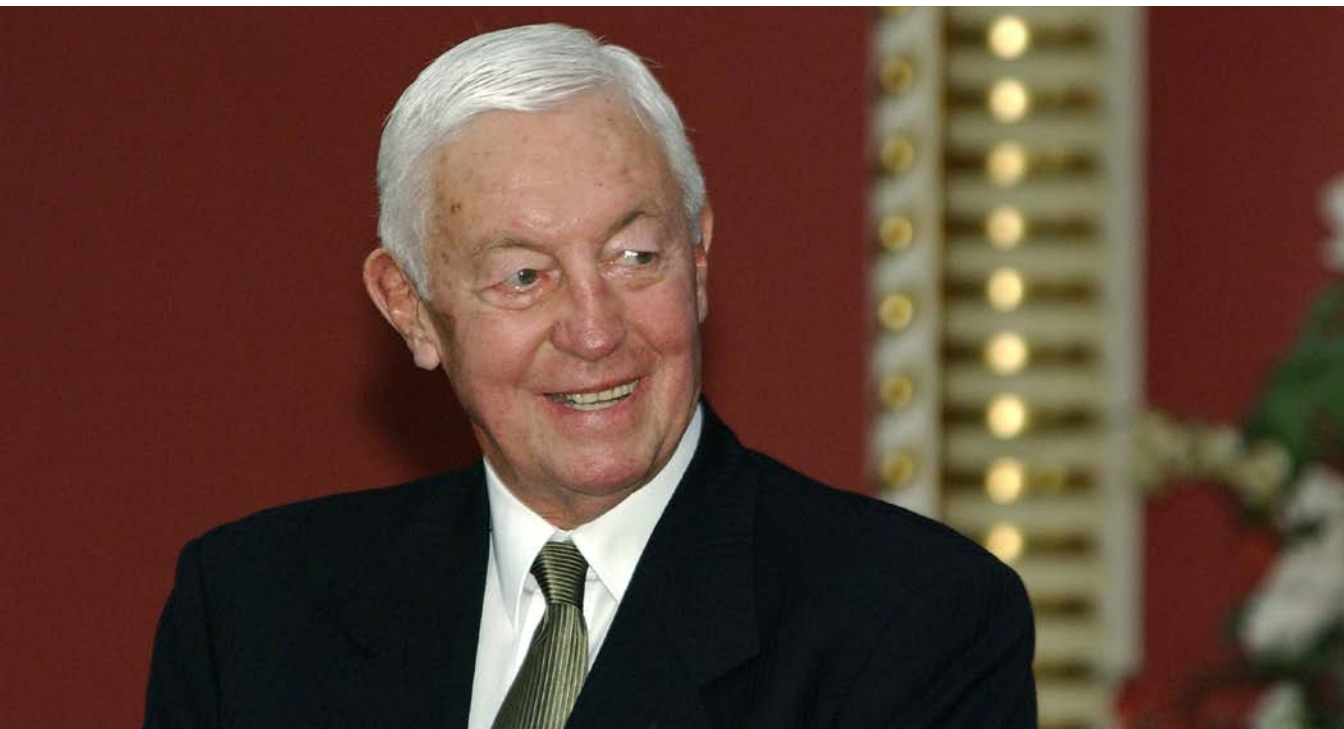
Jean Béliveau, O.Q.