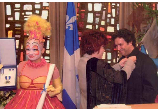
Franco Dragone, C.Q., et Diane Lemieux, ministre d'État à la Culture et aux Communications