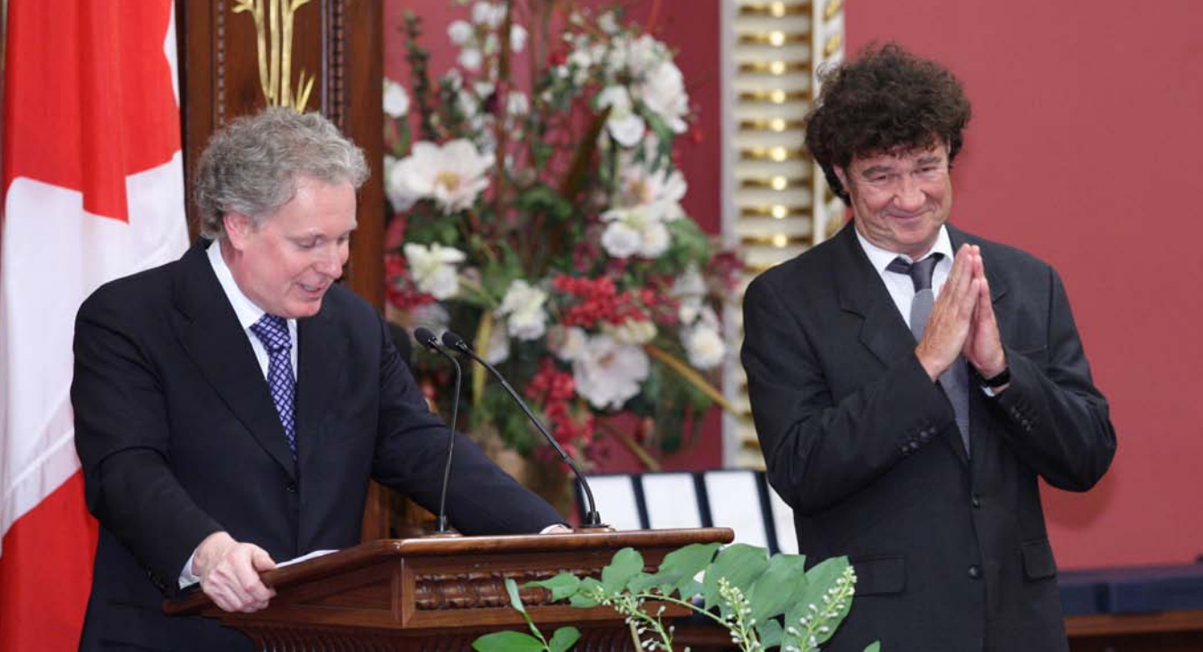
Jean Charest, premier ministre du Québec, et Robert Charlesbois, O.Q.