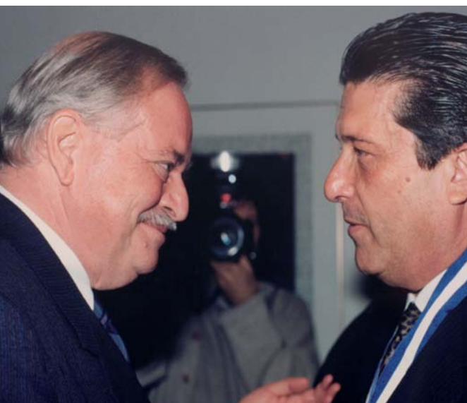
Jacques Parizeau, premier ministre du Québec, et Federico Mayor, O.Q. / ONQ, 1995