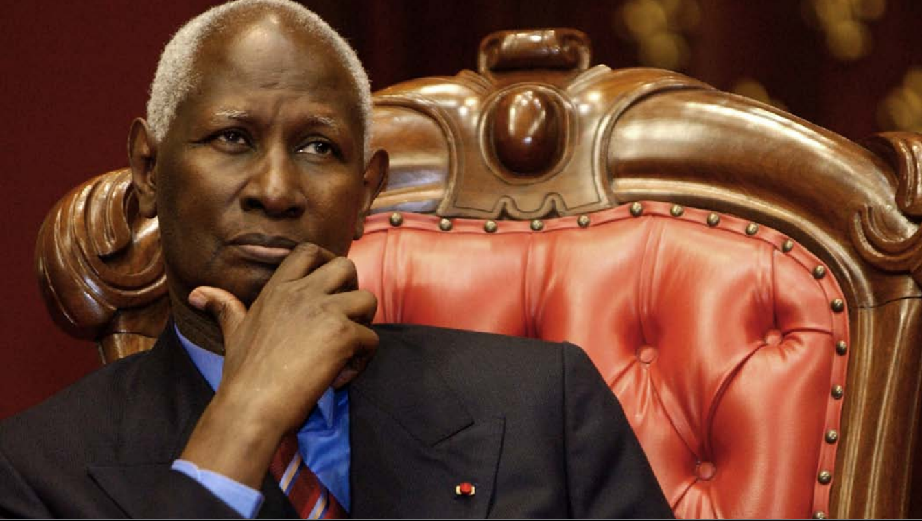
Abdou Diouf