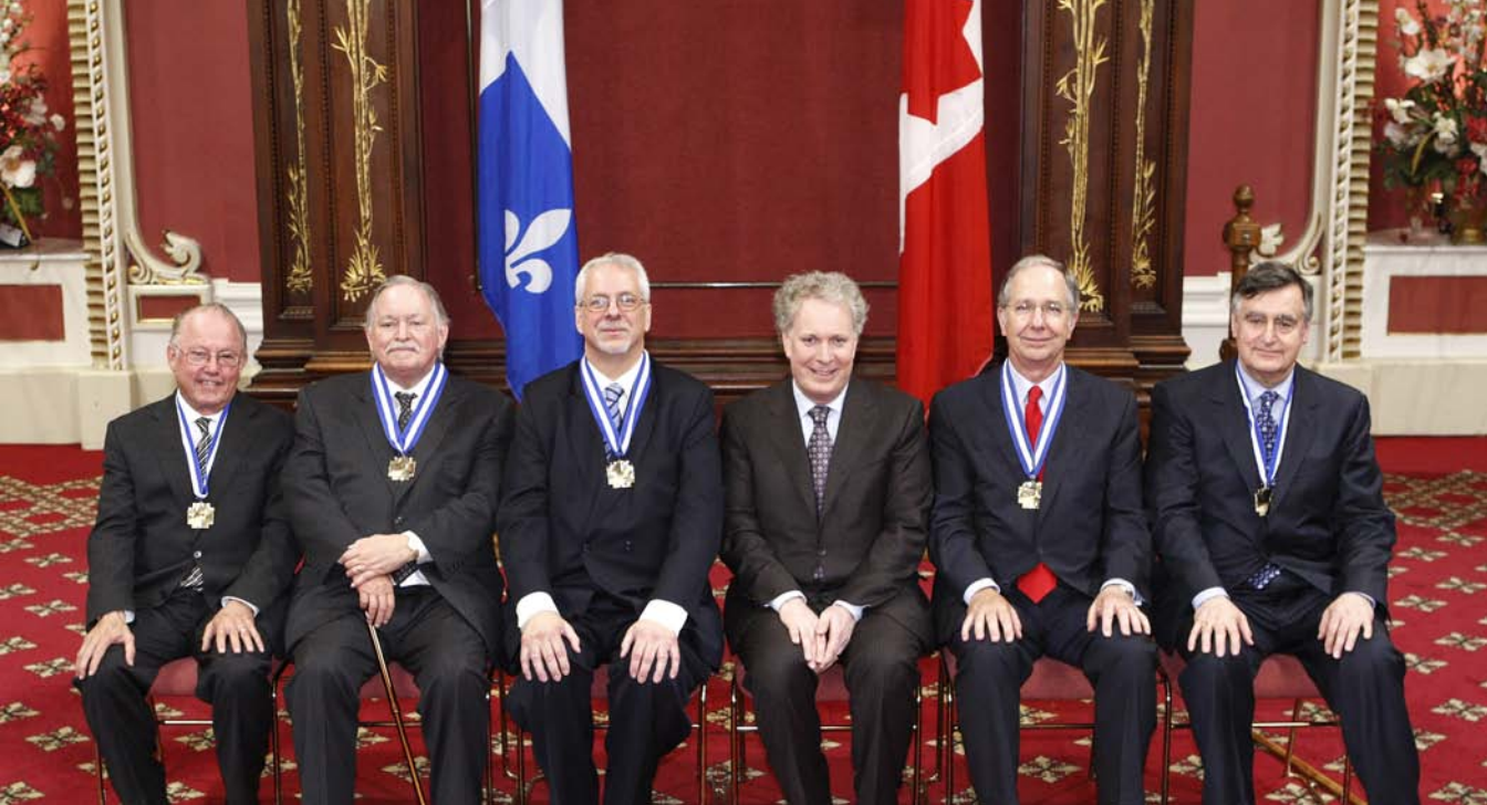
Bernard Landry, G.O.Q., Jacques Parizeau, G.O.Q., Pierre Marc Johnson, G.O.Q., Jean Charest, premier ministre du Québec, Daniel Johnson fils G.O.Q., et Lucien Bouchard, G.O.Q.