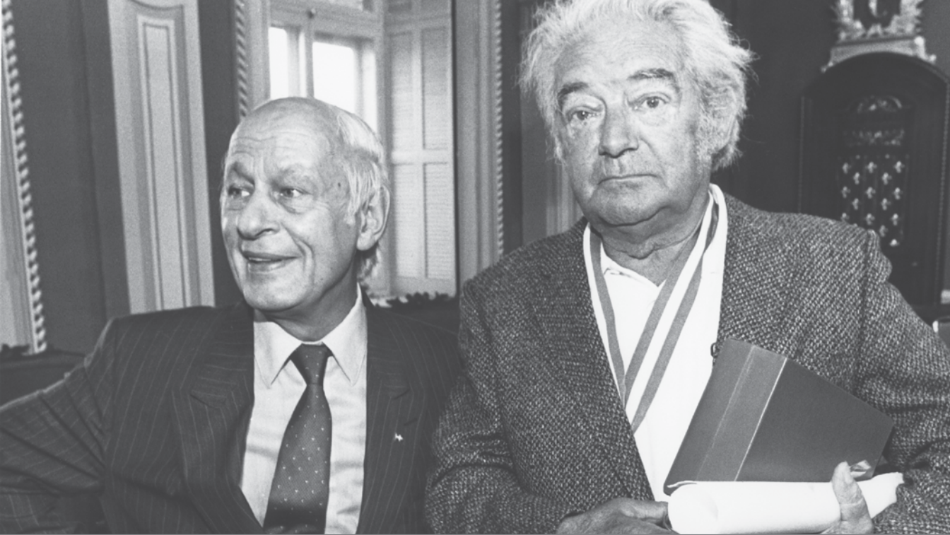
René Lévesque, premier ministre du Québec, et Félix Leclerc, G.O.Q. , 1985