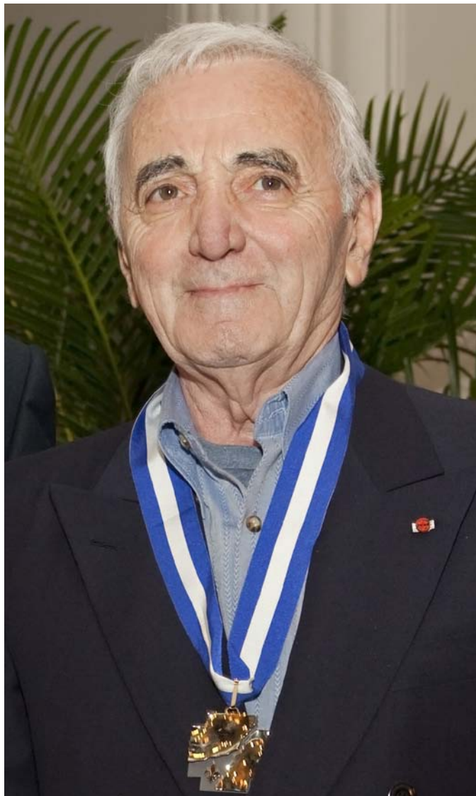
Charles Aznavour, O.Q. / ONQ - Philippe Renault, 2009