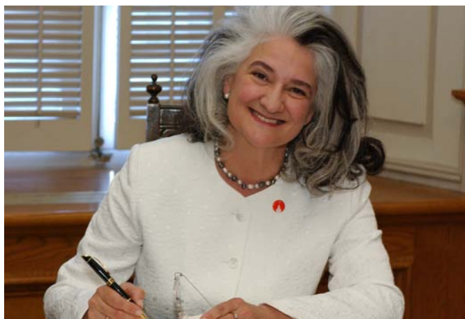
Marie Laberge, C.Q.